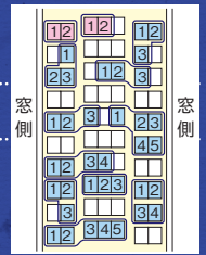
お並び席の一例 ※機材により異なります。

※窓側・通路側などの座席のご希望は承れません。※3名様以上の場合、通路を挟んで、または通路側前後席を含んだお並び席になる場合があります。※4名様以上のグループのお客様には、グループを分割してお並び席をご用意する場合があります。※事前の座席番号指定は承れません。また、事前の座席番号のご案内はしていません。※ビジネスクラスをご利用の場合、当該サービスの対象外になります。